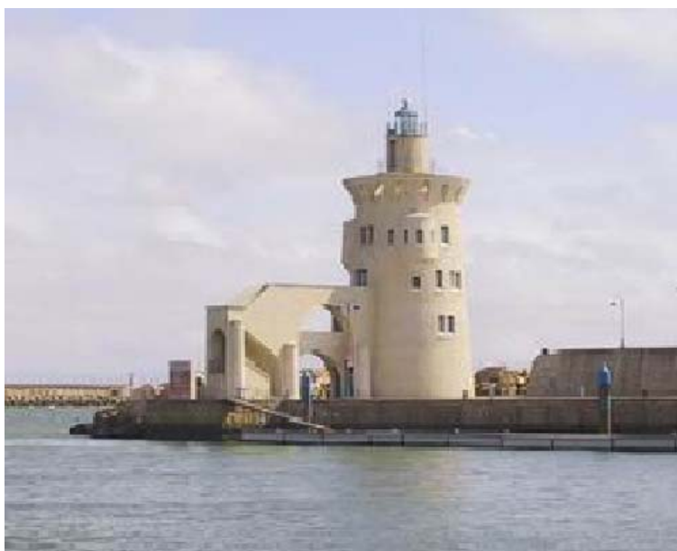
Capitanía Marítima y Faro de Puerto Sherry

EUROPEAN CHAMPIONSHIPS OF SKI RACING TO BE HELD FROM 21st TO 28th AUGUST 2010